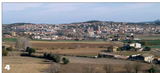
La variant travessaria pels camps entre la Bisbal i Cruïlles, on aniria un enllaç amb la GI-664.

L'anunci del conseller de Política Territorial i Obres Públiques, Joaquim Nadal, al diari El Punt el 4 d'agost passat va fer sonar totes les alarmes. I això que no era el primer cop que Nadal es posicionava a favor de l'opció sud; el 2002 com a Secretari d'Infraestructures del PSC, ja escrivia en aquest sentit. Nadal apuntava el 4 d'agost que un estudi tècnic substituïria l' Estudi d'impacte ambiental de 2006 demostrant que l'opció sud és millor que la nord, ja que aquest, segons deia, va quedar ràpidament desfasat. En un article d'opinió personal publicat a Diari de Girona el 2 de setembre, afirmava que aquest nou treball assenyalarà "la sud com a opció preferent" tot i que també matisava en el text que "el director general de Carreteres [Jordi Follia, natural de Sant Sadurní] és favorable a l'opció nord". El mateix Nadal havia dit un mes abans a El Punt que